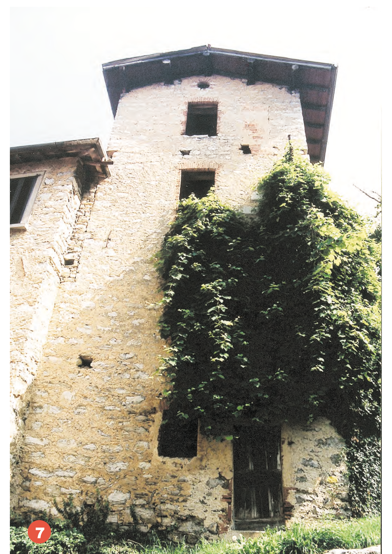
1 Mulattiera a gradoni tra le antiche abitazioni